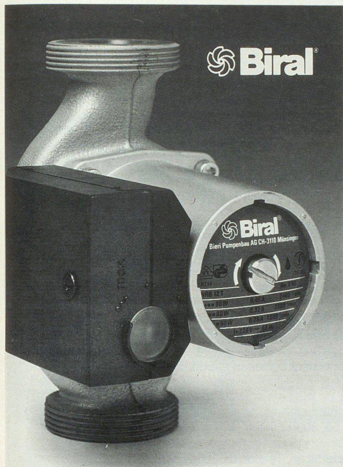
Eine der kleinsten Umwälzpumpen von Biral – bereits seit Jahren SEV-geprüft.