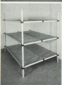
Dreier- und Sechserliegen

Kellergestell in Friedenszeiten. Bequeme Liegestelle im Katastrophenfall, dank integrierter Tuchliegeflächen ist KEINE MATRATZE notwendig.