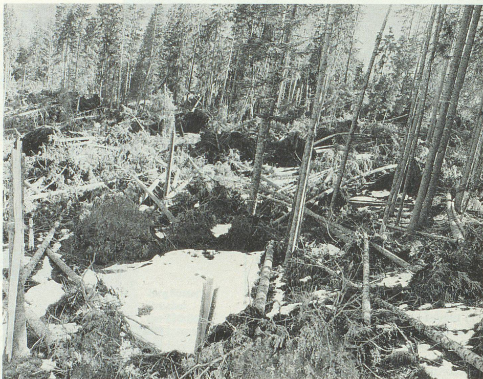
Im Bergwald der Entlebucher Gemeinde Flühli entstanden viele Flächenschäden. Auch wenn alle diese Schadenplätze geräumt werden, braucht es noch viel Geduld, bis der Wald sich wieder erholt hat.

Auf dem Arbeitsprogramm steht Aufräumen von Fallholz, Zusammentragen von Kleinteilen, Wiederaufforsten und Pflanzen von Jungholz, Wegbau und Strassenbefestigung. In der Gemeinde Flühli fielen nach dem Sturm «Vivian» rund 40 000 Kubikmeter Windwurfholz an. Dank Eigeninitiative der Waldeigentümer sowie Einsatz von Militär und Zivilschutz bereits im letzten Jahr konnte ein grosser Teil des gewor-