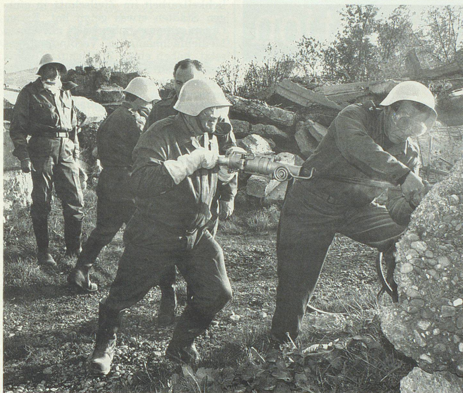
SBG-Betriebsschutzangehörige auf dem Übungsgelände Leutschenbach im Einsatz.