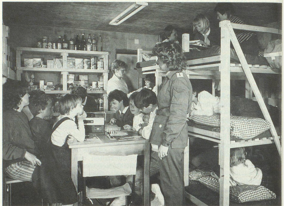
Die Betreuung von Leuten im Schutzraum ist eine anspruchsvolle, aber dankbare Aufgabe.

Erika C. trat dem Zivilschutz aus einem ganz besonderen Grund bei. Im Untergeschoss des Einfamilienhauses der Familie C. befindet sich ein Ge-