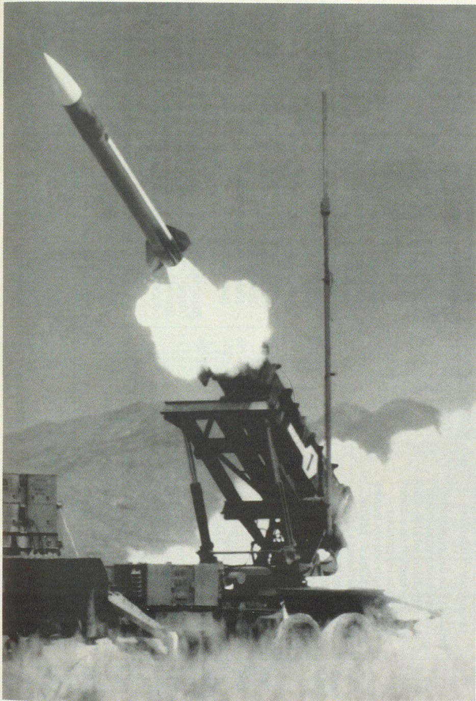
Amerikanische Patriot-Rakete in Abschussphase.