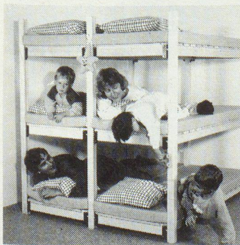
WISTHO-Schutzraumliegen sind 100% schweizerisch: Holz, Patent, Verarbeitung, Vertrieb