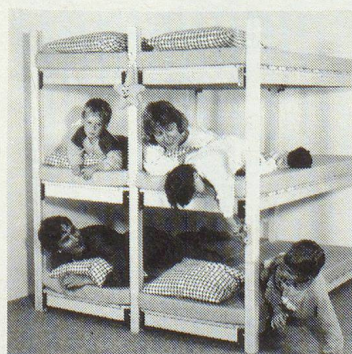
WISTHO-Schutzraumliegen sind 100% schweizerisch: Holz, Patent, Verarbeitung, Vertrieb

TELED TELED TELED TELED TELED TELED TELED TELED TELED TELED