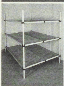
Dreier- und Sechserliegen

Kellergestell in Friedenszeiten. Bequeme Liegestelle im Katastrophenfall, dank integrierter Tuchliegende ist KEINE MATRATZE notwendig.