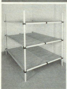
Dreier- und Sechserliegen

Kellergestell in Friedenszeiten. Bequeme Liegestelle im Katastrophenfall, dank integrierter Tuchliegefläche ist KEINE MATRATZE notwendig.