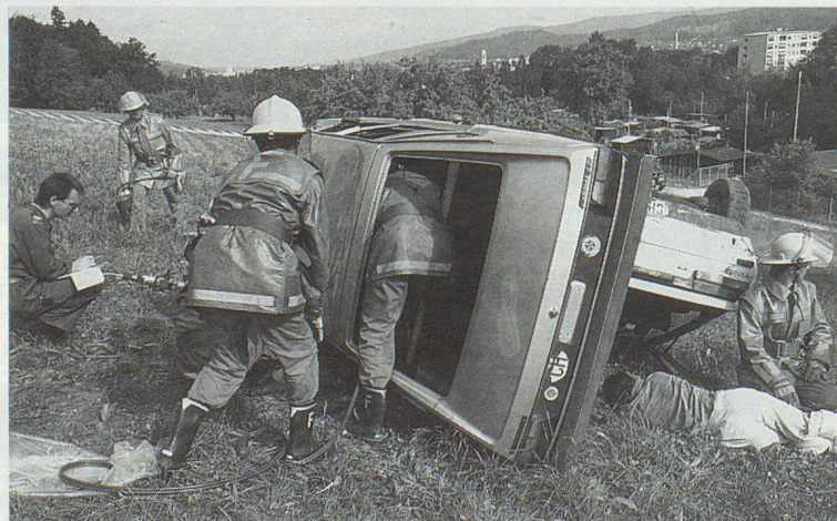
Ein spektakulärer Verkehrsunfall mit mehreren Verletzten erforderte rasches und richtiges Handeln.