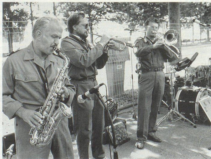
Die Zivildschutzkader-Band Ostermundigen spielte zur Matinee auf.

Bei der Veranstaltung ging es darum, die Leistungen von Männern und Frauen der Miliz im Dienste der Ge-