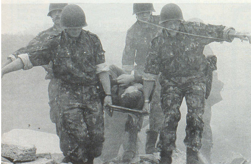
Rettingsaktion der Luftschuttsoldaten. Action de sauvetage des soldats de la protection aérienne. Un'azione di salvataggio delle truppe di protezione aerea.