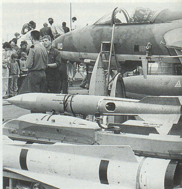
Hunter mit Waffenarsenal. Le «Hunter» et son armement. Un Hunter e il suo arsenale di armi.