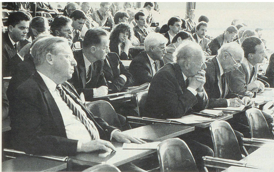
Auf grosses Interesse stiess das Thema «Modelle einer schweizerischen Friedenspolitik», welches am Forum 91 unter den Befürwortern und Gegnern unserer Armee eine engagierte Diskussion auslöste.

nicht nur weiterpflegen, sondern ihn auch weitervermitteln».