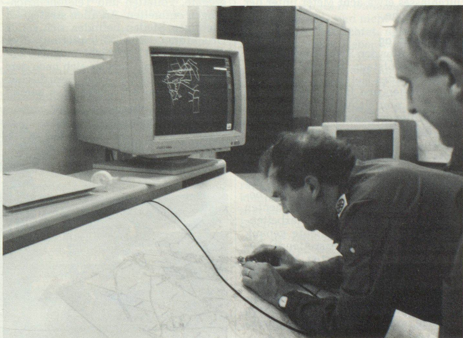
Inzwischen wird die Gemeinde Winkel «digitalisiert».