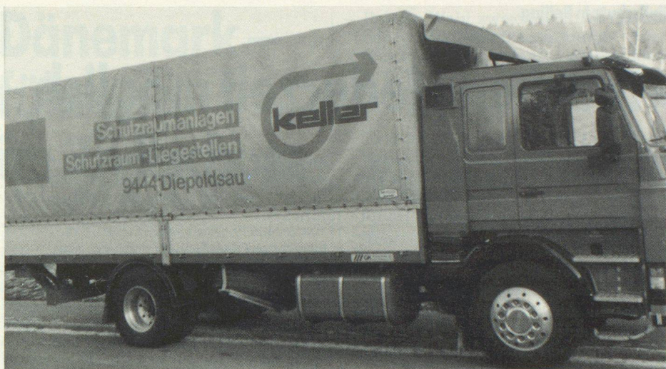
Mit drei Lastwagen erfolgte die Anlieferung der Liegestellen und Notaborte nach Winkel.