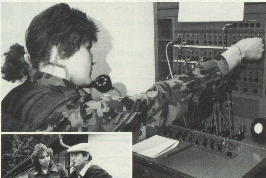
Frauen im Dienst der Armee: Bald neue Einsatzmöglichkeiten und vertiefte Fachausbildung.