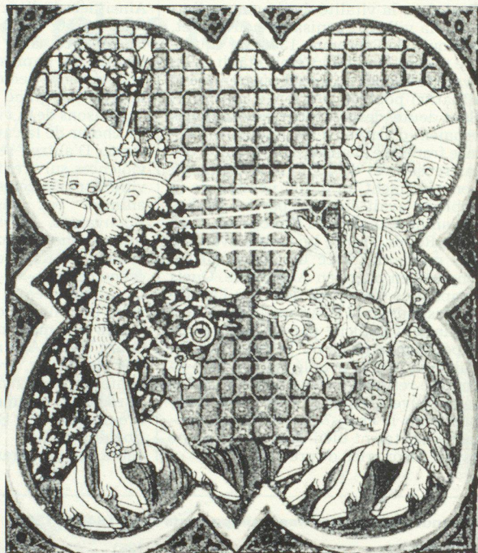
Deux scènes (non réalistes, mais bien plutôt symboliques) de la bataille de Poitiers du 19 septembre 1356 (Miniatures extr. des Grandes Chroniques de France).

mencer. Ainsi, personne n'était là pour combattre le feu, et toute la ville fut la proie des flammes. Seuls les faubourgs – à part celui de Saint-Alban, d'où l'incendie était parti – furent épargnés.