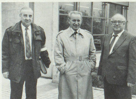
Der Zivilschutzdirektor des Kantons St.Gallen, Regierungsrat Alex Oberholzer, zusammen mit dem Direktor des BZS und dem Vorsteher des Kantonalen Amtes für Zivilschutz auf «Inspektionsreise».

Kritik wurde auch an der Organisation der Führungsstäbe geübt; zwischen der kantonalen und den kommunalen Führungsstäben fehle eine regionale Organisation, hiess es seitens der Gemeinden. Niedermann stellte fest, dass aus dieser Erfahrung heraus die Idee der Leitgemeinden, welche gewisse Aufgaben anderer Gemeinden zu übernehmen hätten, zugunsten einer regionalen Lösung überprüft werden müsste.