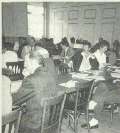
Une partie de l'assemblée durant les débats.

Le préfet de la ville de Bienne a évoqué un historique de la ville et de ses habitants à l'occasion d'un sympathique apéritif offert par la Municipalité et servi par le caviste en personne entouré de gentes dames en costume folklorique.