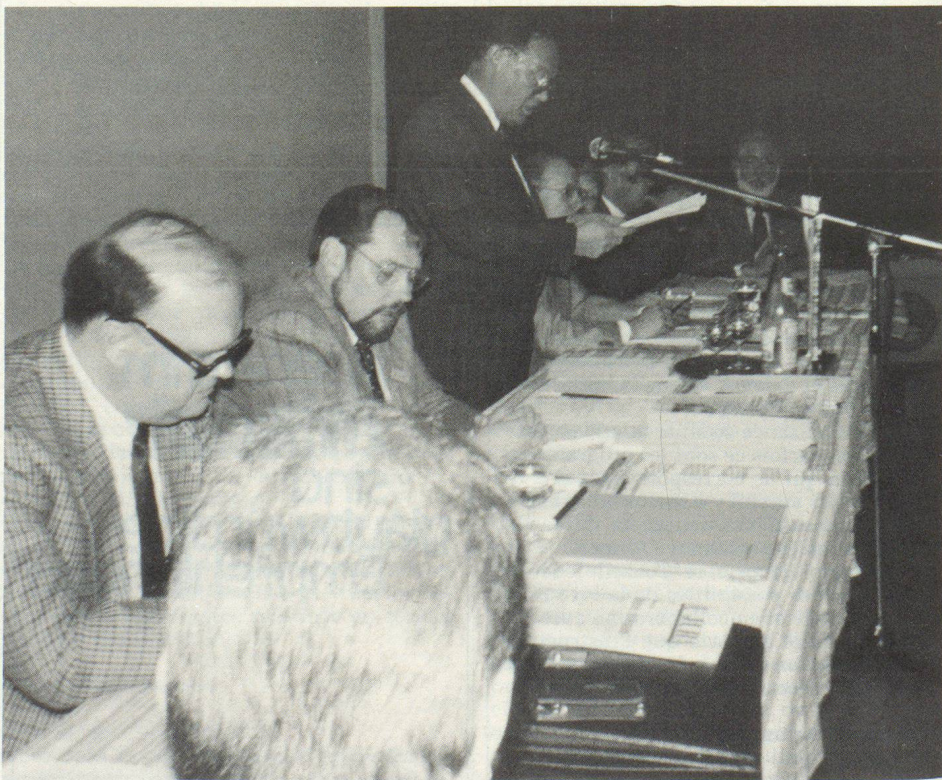
Le rapport présidentiel retient l'attention.