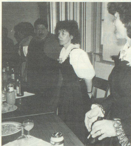
Enfin, la dégustation d'un apéritif bienvenue.

Au terme d'un succulent repas, servi au restaurant de l'Union, l'assemblée s'est