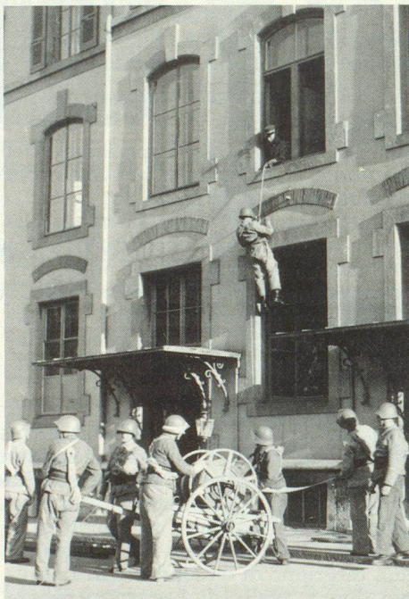
Esercizio di salvataggio della protezione antiaerea ferroviaria blu nel 1950.

tervento. Come mezzi di spegnimento sono disponibili 44000 litri d'acqua, 1000 litri di schiuma di spegnimento e 1000 kg di polvere per estinguere gli incendi. Le due autopompe montate sui tetti delle cabine trasportano 2400 litri d'acqua al minuto. L'impianto di aria da respirazione comprende in totale 48 bombole con un volume di 480 000 litri di aria. Questa riserva basta a rifornire d'aria 60 persone nel vagone di salvataggio per più di 3 ore negli interventi