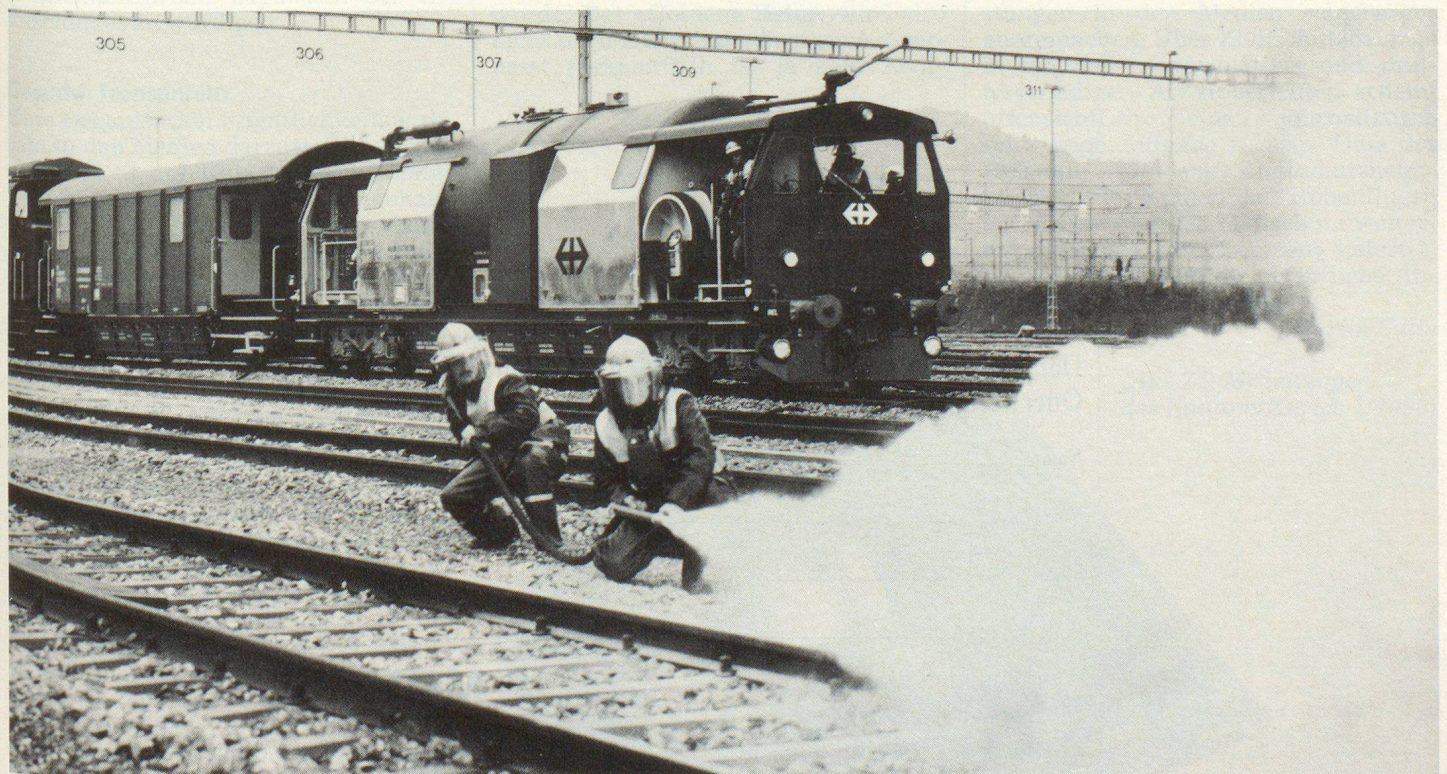
La difesa dell'impresa durante un intervento con il treno di spegnimento e di salvataggio.

Nel corso della storia delle ferrovie, che ha ormai più di 150 anni, la sicurezza ha raggiunto un livello notevole. Le ferrovie in Svizzera sono uno dei mezzi di trasporto più sicuri; gli incidenti gravi sono diventati improbabili, ma naturalmente non possono essere del tutto esclusi. La sicurezza tecnica delle ferrovie in Svizzera è straordinariamente avanzata nel settore della prevenzione. Per quanto concerne i propri organi d'intervento, non conosciamo nessun'altra ferrovia europea con un così grande potenziale di mezzi in personale e materiali. La collaborazione di tutte le parti interessate in caso di eventi con danni inevitabili di qualunque origine, l'intervento adeguato delle formazioni ha un carattere umanitario e contribuirà a limitare il più possibile tali eventi. ▀