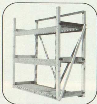
Schutzraumliege BK 86