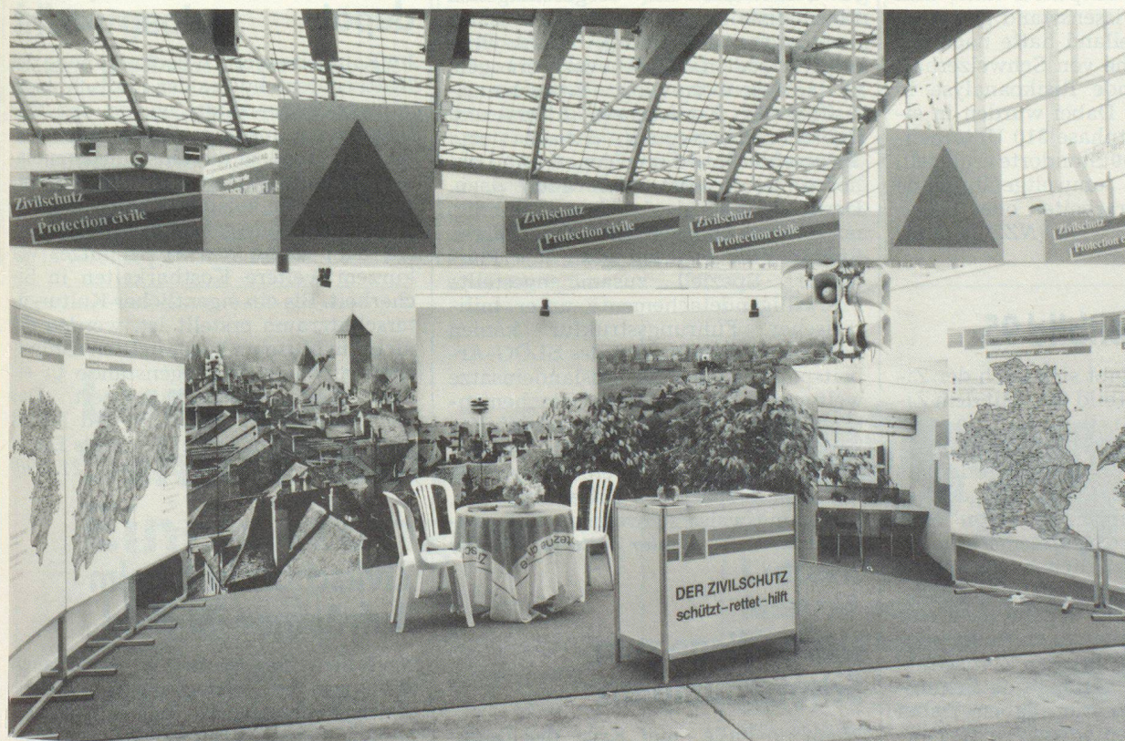
Der Zivilschutzstand an der BEA zum Thema «Alarmierung der Bevölkerung in Katastrophen».

Während die wenigsten Besucher wussten, dass auch im Frieden die Bevölkerung mit den Alarmierungsmitteln des Zivilschutzes alarmiert werden kann, erklärten acht von zehn Befragten: «Bei allgemeinem Alarm höre ich Radio». Ein wohlthuendes Zeichen, dass stete Information, hier zum Beispiel über Probealarme, wirklich Früchte trägt. ▀