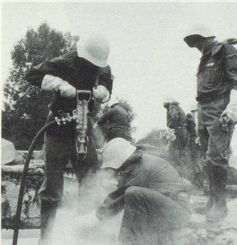
Ob hängend im Seil, stossend am Pressluftbohrer oder kämpfend am Schlauch – in der Betriebschutzorganisation (BSO) werden alle Handgriffe geübt, die im Katastrophenfall zur Rettung von Menschenleben von entscheidender Bedeutung sind.