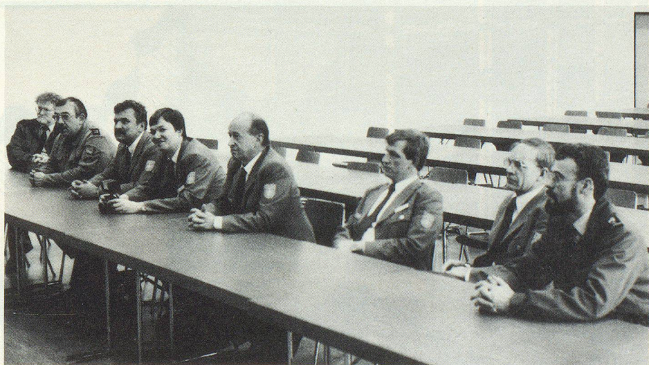
Interesse am schweizerischen Zivilschutz: Angehörige des deutschen Katastrophenschutzes THW.

Neben Katastropheneinsätzen im eigenen Land halfen Angehörige des THW in den letzten Jahren vor allem in den Katastrophengebieten von Mexiko, Ecuador, Somalia und Armenien. ▲