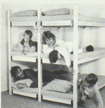
WISTHO-Schutzraumliegen sind 100% schweizerisch: Holz, Patent, Verarbeitung, Vertrieb

– Mit Wohngemeinde wird diejenige Gemeinde bezeichnet, in welcher ein