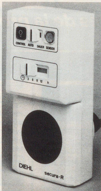
Diehl Secura-R, Schaltuhr mit Zufalls-Schaltprogramm.

Bruno Winterhalter AG Werkstrasse 5 9000 St.Gallen Telefon 071 24 94 14