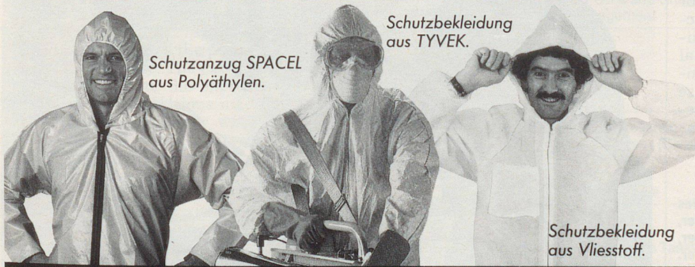
Schutzanzug SPACEL aus Polyäthylen.