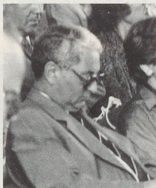
Consigliere nazionale François Jeanneret, Neuchâtel

Non è indispensabile che tutti i cittadini siano al corrente dell'esistenza e dell'attività del Consiglio. Mi sembra molto più importante che siano invece note l'idea della difesa integrata e della sua concezione. La sua «infrastruttura» e i suoi obiettivi sono piuttosto materia