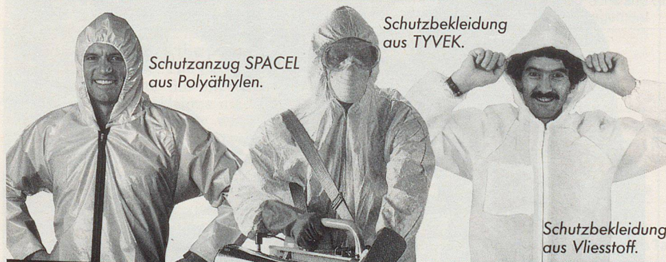
Schutzanzug SPACEL aus Polyäthylen.