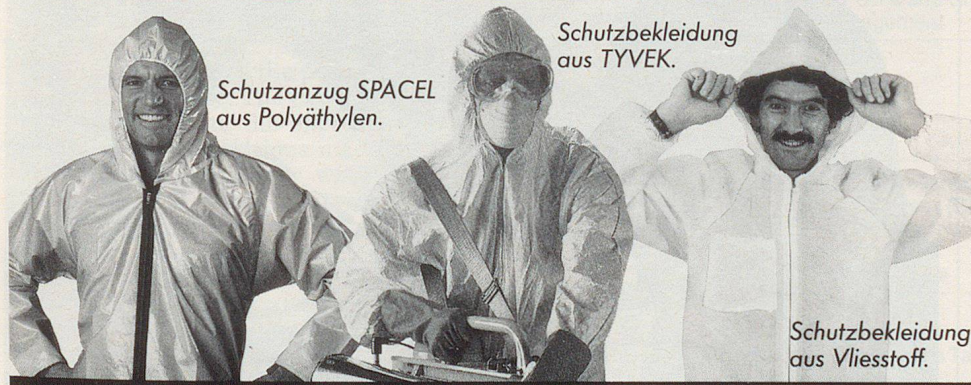
Schutzanzug SPACEL aus Polyäthylen.