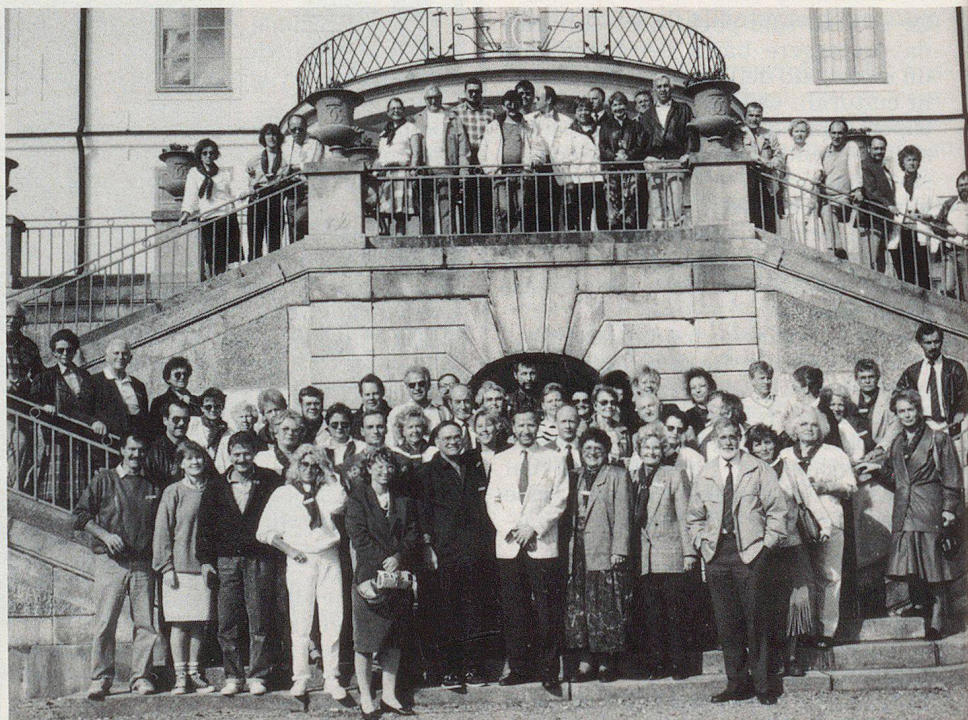
Au château de Rosersberg... un groupe de quelques 70 participants, pas une petite affaire à conduire!

célèbre et le plus vieux du monde affirme le guide touristique. Créé en 1891, ayant servi de modèle à beaucoup d'autres musées du même type (p.ex. Ballenberg), il offre environ 150 bâtiments historiques qui évoquent les diverses provinces suédoises. Des chaumières, des manoirs, des huttes de Lapons, des fermes et des boutiques de