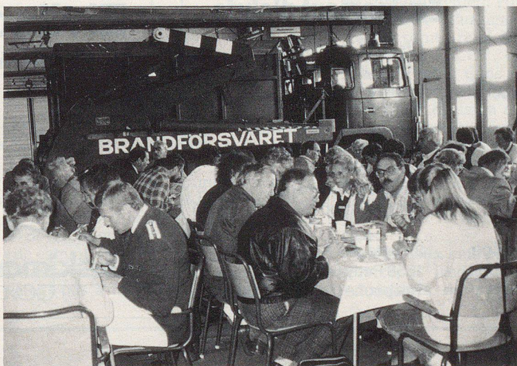
Le repas de guerre servi à l'intérieur de locaux techniques ultra-modernes (Centre de formation d'Uppsala en voie d'achèvement).