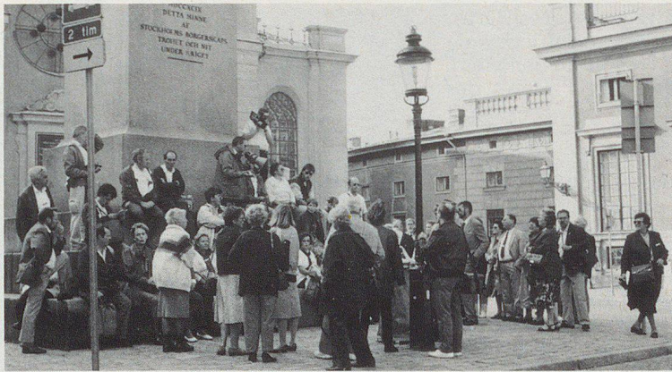
Un groupe attentif aux explications lors de la visite «Gamla Stan» (vieux Stockholm).

Le voyage de retour s'est effectué dans les meilleures conditions, chacun retrouvant son foyer et, selon une formule en usage dans le comité de l'AI RPC, «prêt pour de nouvelles aventures».