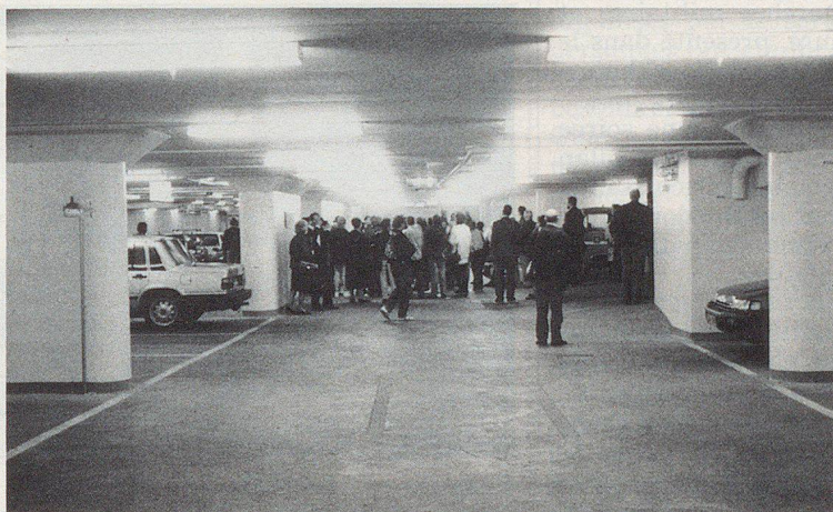
La visite d'un abri pour la population au centre de la ville de Stockholm (capacité: 6000 places protégées).