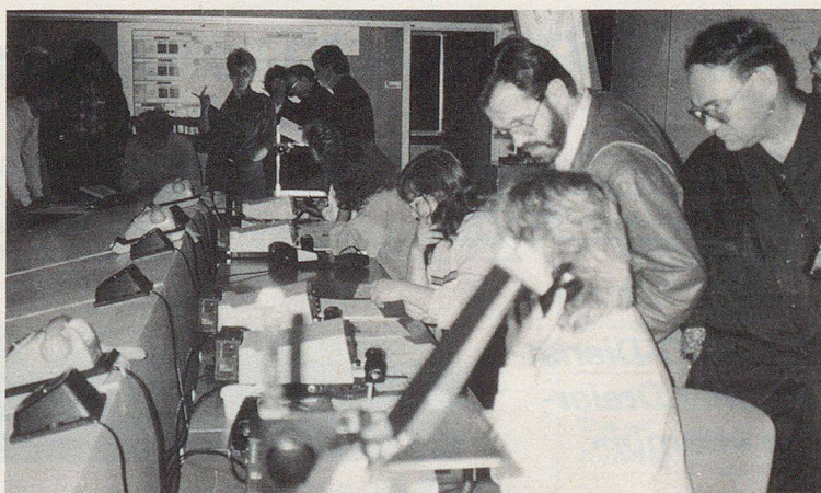
Une démonstration des plus intéressante d'un cours combiné d'état-major.