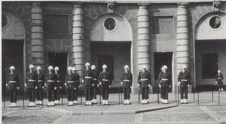
La relève de la garde au palais royal.