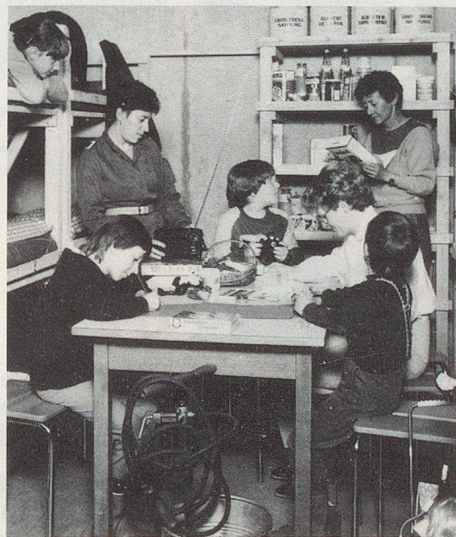
Les communes manquent avant tout de chefs d'abri.

Selon les directives actuellement en vigueur, le nombre nécessaire des chefs