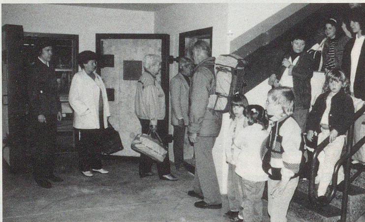
In den Gemeinden fehlen vor allem Schutzraumchefs.

Geltenden Richtlinien zufolge benötigt man in der Schweiz rund 95 000 Schutzraumchefs, Schutzraumchef-Stellvertreter und Chefs Schutzraumhauptabteil sowie rund 95 000 Chefs