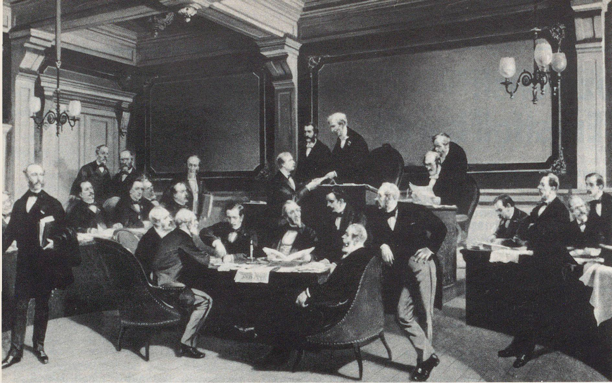
Diplomatische Konferenz von 1864.

Vor 125 Jahren, am 22. August 1864, haben 26 Vertreter von 16 Staaten in Genf auf Initiative des Internationalen Komitees vom Roten Kreuz (IKRK) die Idee Henry Dunants in die Tat umgesetzt und das erste Genfer Rotkreuz-Abkommen zur Verbesserung des Loses der verwundeten Soldaten der Armeen im Felde abgeschlossen.