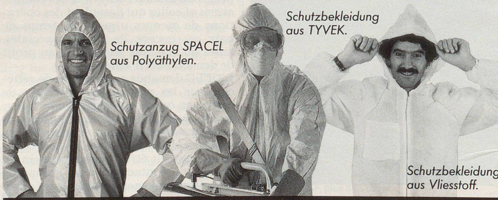
Schutzanzug SPACEL aus Polyäthylen.