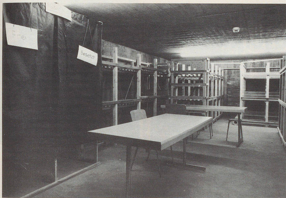
Depuis le 1er janvier 1986, tous les abris doivent être équipés de lits et toilettes de secours. Les lits qu'on trouve dans le commerce sont en bois ou en métal.

bitants de ces immeubles devront se rendre dans l'immeuble x situé dans la rue y. L'aide-mémoire de la protection civile qui figure dans les dernières pages des annuaires téléphoniques vous fournit de plus amples informations. Voilà un des systèmes envisageables pour faire connaître l'attribution des places protégées.