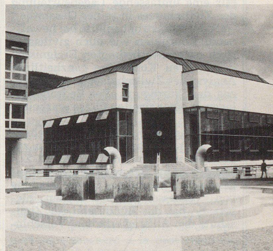
Centre de congrès de l'Université.

9.00 – 10.00 Uhr Eintreffen der Delegierten und Gäste Kaffee und Croissants in der Cafeteria der Faculté des lettres 10.15 – 12.00 Uhr Offizieller Teil der DV SZSV in der Aula der Faculté des lettres, anschliessend Referat von François Jeanneret, Nationalrat Für Begleitpersonen, Vorführung der Androiden/Automaten von Jaquet-Droz im Musée des Beaux-Arts in Neuenburg 12.00 – 12.45 Uhr Apéritif, offeriert vom Stand Neuenburg begleitet vom Musik- corps «Les Armourins» 12.45 – 15.00 Uhr Mittagessen im Restaurant des Jeunes Rives, Quai Robert-Comtesse 4 15.30 – 16.30 Uhr Schifffahrt auf dem Neuenburgersee