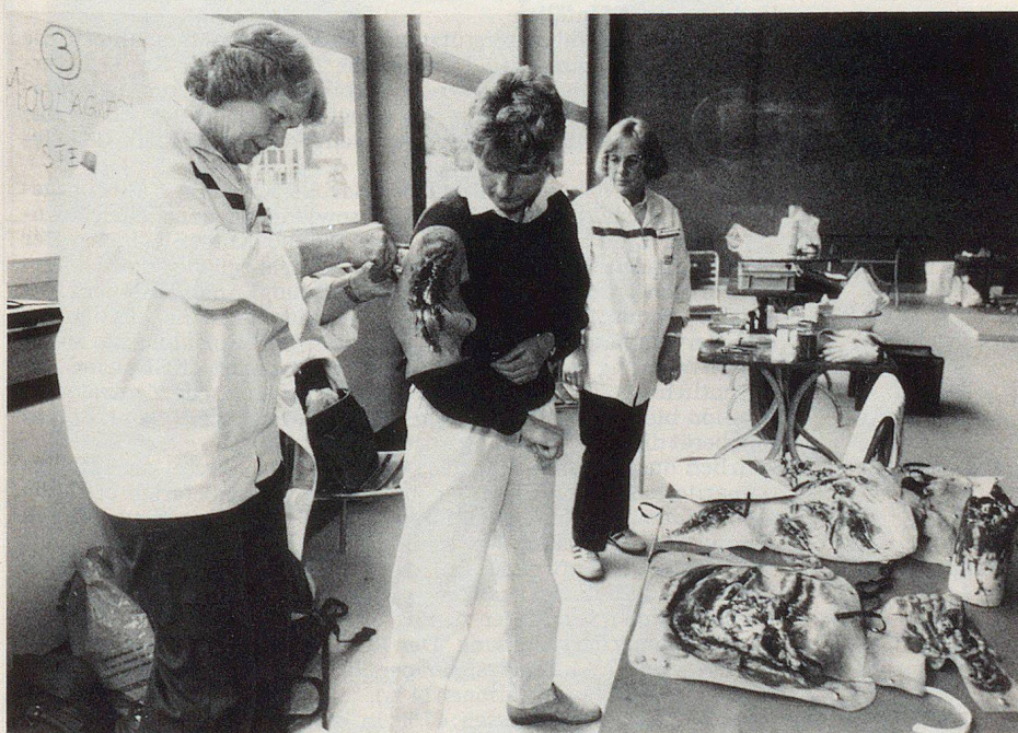
Samariterinnen beim Moulagieren. Die Bilder stammen aus der KSD-Übung Föhnsturm vom Mai 1987. Samariter waren daneben auch als Hilfspersonal in einem Basisspital sowie als Figuranten im Einsatz.