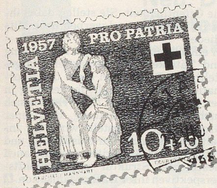
Samariterbildnis auf Briefmarken.

geben will. Dieser Kurs ist der erste Schritt zu einer Angebotspalette mit neuen Kursen, die sich an bestimmte Bevölkerungsgruppen richten. Gegenwärtig erarbeitet der Samariterbund einen Kurs, der speziell auf die Bedürfnisse der Senioren ausgerichtet ist. Zusammen mit dem SRK veranstalten die Samaritervereine seit jeher auch Kurse in der häuslichen Krankenpflege.