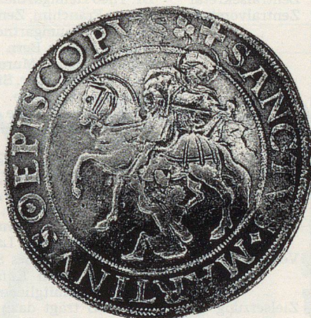
St. Martin als Sujet auf einer Münze.

In ländlichen Gegenden ersetzen ständige Samariterposten oft fehlende ärztliche Versorgung. Rund 600 Samaritervereine führen mindestens einen ständigen Samariterposten. Auch hier sind es die Innerschweizer Vereine, die das dichteste Netz unterhalten.