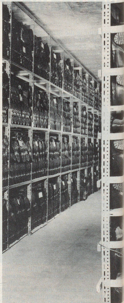
Die Stiefel gehören (noch) nicht zur persönlichen Ausrüstung.

meiner Organisation die persönliche Ausrüstung abgegeben habe, und zwar inklusive Schutzmaske. Es war ein Entscheid, der mich etwas Zivilcourage gekostet hat; allerdings fühle ich mich seither sehr wohl, denn ich weiss: weder im Ernstfall noch während Übungen benötige ich unnötige Zeit, um meine Zivilschutzorganisation mit dem persönlichen Material auszurüsten. Dies immer im Bewusstsein, dass bei Ortswechsel eines Zivilschutz-Dienstpflichtigen durch die Abgabe der Ausrüstung grössere Umtriebe entstehen. Die Zivilschutzstelle wie ich nehmen diese Zusatzaufwendungen jedoch gerne auf sich, da damit wertvolle Einsatz- und Ausbildungszeit entsteht. Mein Anliegen ist, dass die Eidgenossenschaft bzw. die Kantone diesem Erfordernis möglichst bald Rechnung tragen. Sofern auf eidgenössischer Ebene der Zivilschutz ernstgenommen wird, müsste dieser Misstand bald beseitigt werden. ▢