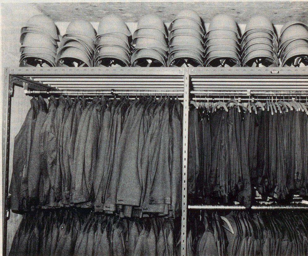
Müssen die Zivilschutzpflichtigen ihre Ausrüstung bald zu Hause aufbewahren?

Werden diese kurz aufgelisteten Überlegungen berücksichtigt, dann kann ich auf meine eingangs erklärte Zustimmung in positivem Sinn zurückkommen und die Abgabe der persönlichen Ausrüstung befürworten. Bevor man jedoch «zur Tat» schreitet, wird man wohl noch zusätzlich denken müssen – und zwar nicht nur in den Köpfen «unter der Bundeskuppel», sondern über die Kantone hinaus bis hin zu den Gemeinden. Zum Gespött werden wollen wir nicht mit dem Thema «Ausrüstung»... ▴