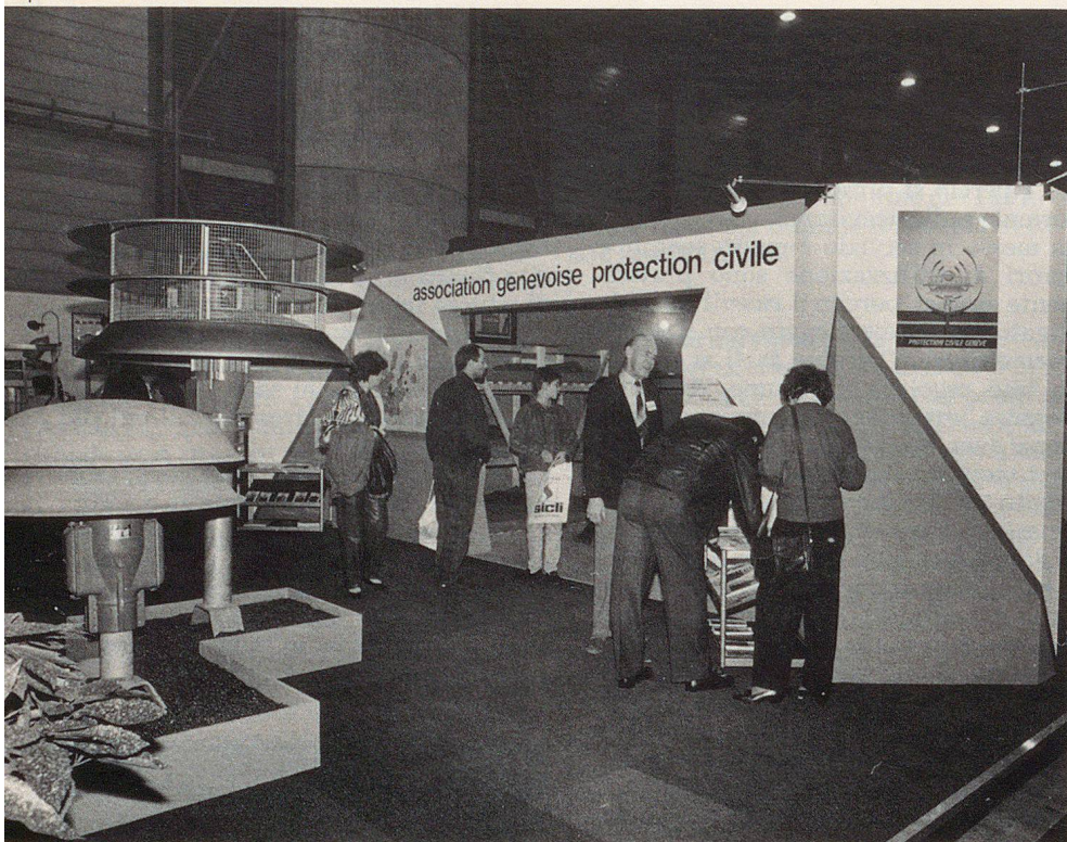
Un stand parlant de lui-même, une information claire et attrayante, les Arts Ménagers: une autre façon de faire connaître la protection civile.