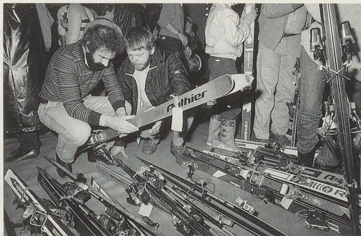
SUPFS: un engagement de «tous les jours». (SUPFS)

fèrent à la SUPFS sa puissance et sa pérennité, à savoir: la participation sur un plan humain, l'engagement volontaire et le courage d'innover qui est le propre des véritables pionniers.