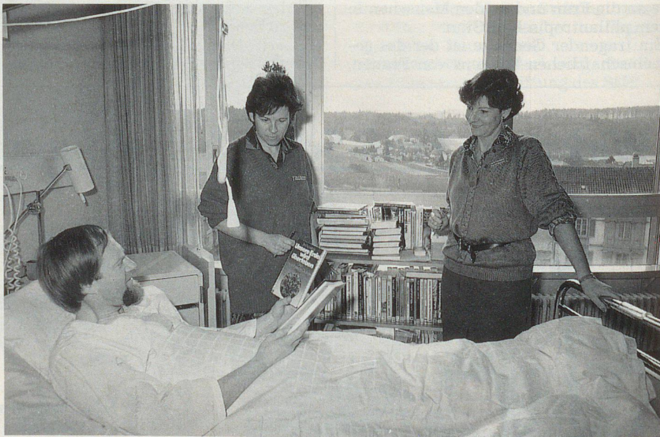
La SUPFS-fondation «Pflegeri» (Pflegerinnenschule) à Zurich.

La Société d'utilité publique des femmes suisses (SUPFS) est une organisation à laquelle appartiennent toutes les associations de femmes suisses dont le but est le service de l'intérêt commun, c'est-à-dire le travail bénévole. Les membres de nos sections, qui sont autonomes, prennent des res-