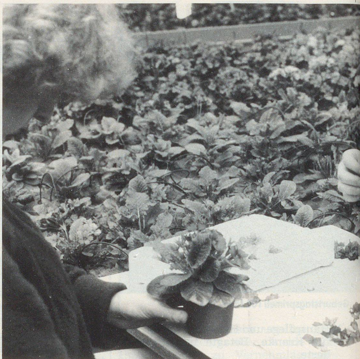
Le bouquet d'anniversaire des 100 ans de la SUPFS.

ush. Les 3 et 4 mai 1988, la Société d'utilité publique des femmes suisses (SUPFS) a célébré ses 100 ans d'existence. Plus de 1000 femmes, des personnalités importantes et la presse se sont donné rendez-vous pour une impressionnante célébration. Parmi les événements qui ont marqué ces festivités, accompagnées d'allocutions – Mme Kopp, conseillère fédérale, a honoré de sa présence cette association féminine, la plus ancienne de toutes, à laquelle elle a adressé ses salutations – à travers les concerts, les productions théâtrales et, surtout, les entretiens et les contacts entre les femmes elles-mêmes, on a pu se rendre compte des facteurs qui con-