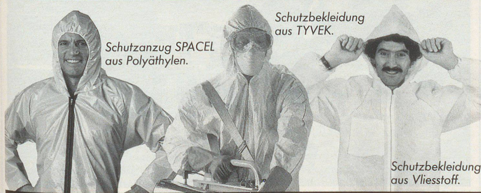
Schutzanzug SPACEL aus Polyäthylen.