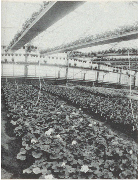
Geburtstagsprimeli 100 Jahre SGF.