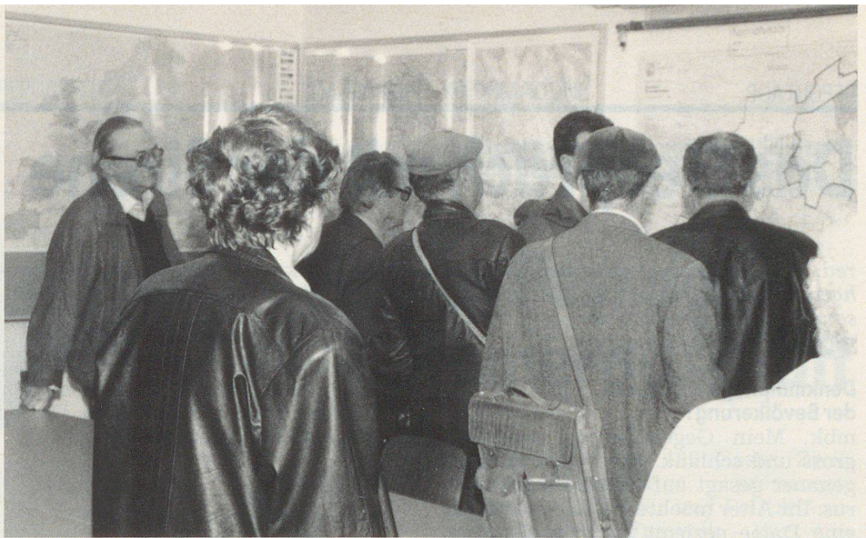
Reges Interesse zeigten die vielen Besucher.

Und wie sagte der Architekt? «Die fehlende Kreativität habe ich damit gelöst, dass ich in Zusammenarbeit mit der Baukommission wenigstens die vielen Rohrleitungen mit bunten Farben habe bemalen lassen.»