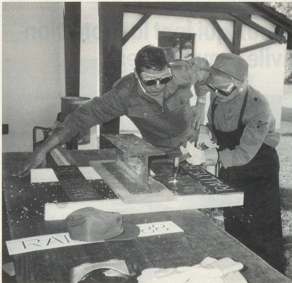
Et l'on est sérieux au travail... sous l'œil attentif de l'instructeur.