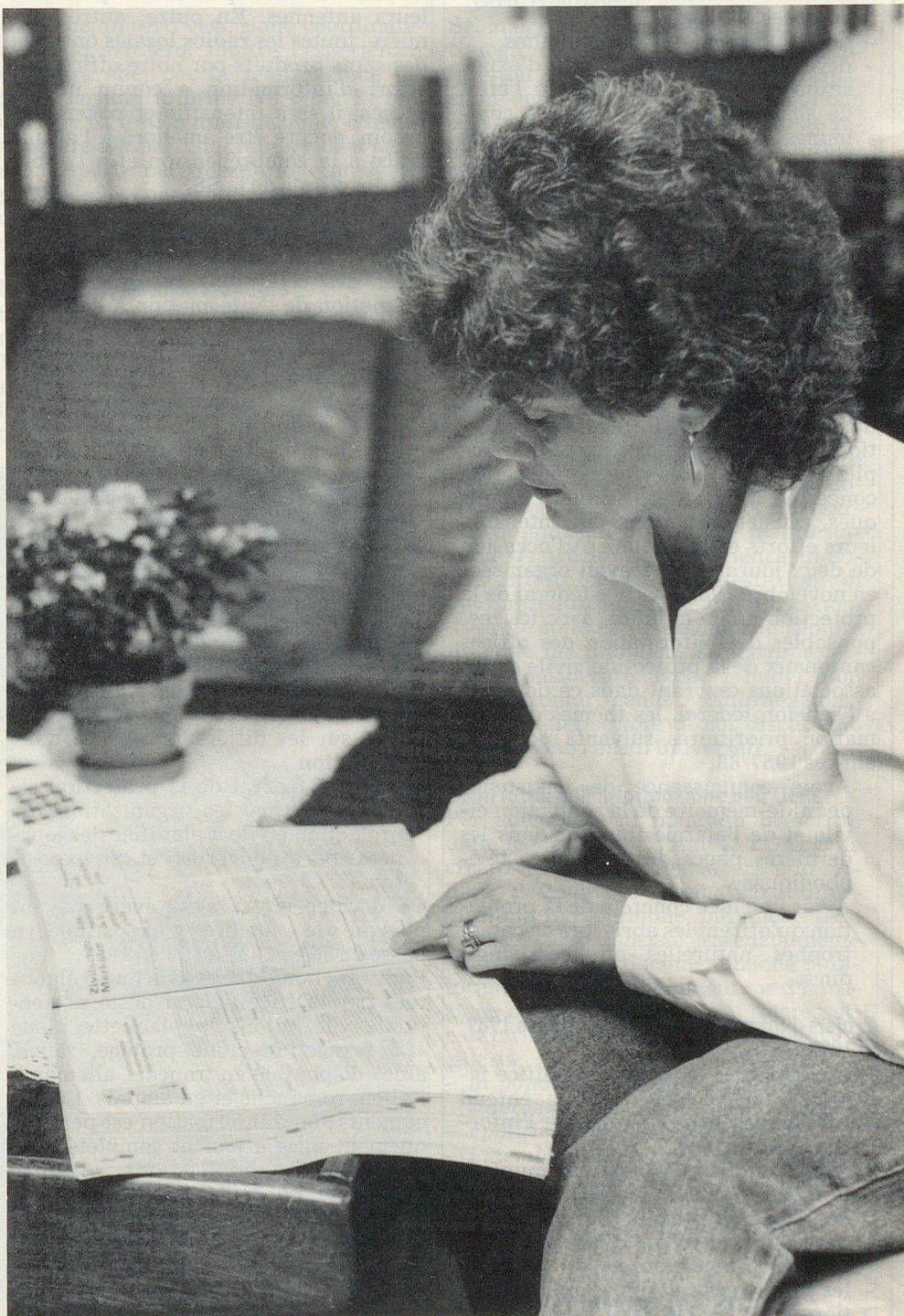
Les dernières pages de l'annuaire téléphonique.