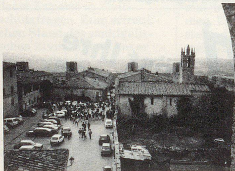
Die Piazza: das Herz einer jeden italienischen Stadt.

Was mich im Orte selbst am meisten verblüffte, war der beiliegende Brief, der am «Albo Comunale» (Anschlagbrett der Gemeinde) ausgehängt war. Ich dachte bis jetzt, die «Protezione Civile» in Italien sei eine paramilitärische Organisation und musste nun feststellen, dass es daneben noch eine zweite «Schatten»-Bewegung gibt. Über den Pretore (Amtsrichter) und die Sindaci (Bürgermeister) werden die uffici tecnici (technische Werke der Gemeinde)