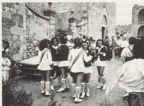
Mitmachen ist oberstes Gebot: für junge...