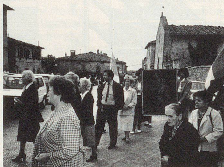
...und gesetztere Jahrgänge.

beauftragt, einen Gefahrenkataster der Gemeinden aufzunehmen und mögliche Hilfemassnahmen vorzubereiten. Da diese Parallelorganisation nur über Gemeindemittel verfügt, lassen sich die Sindaci etwas einfallen.