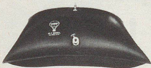
Wasserversorgung Ravitaillement en eau