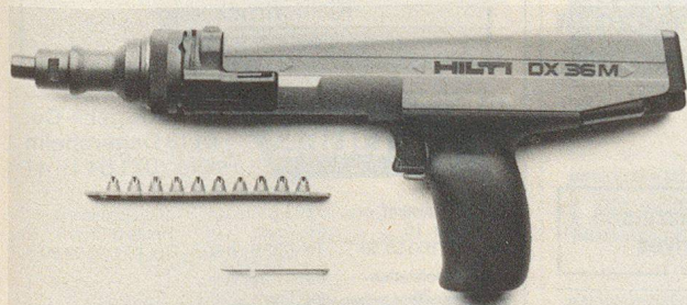
DX 36 M, die neue Dimension in der Direktmontage.

Hilti (Schweiz) AG Soodstrasse 61 8134 Adliswil Telefon 01 712 12 12