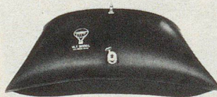
Wasserversorgung Ravitaillement en eau