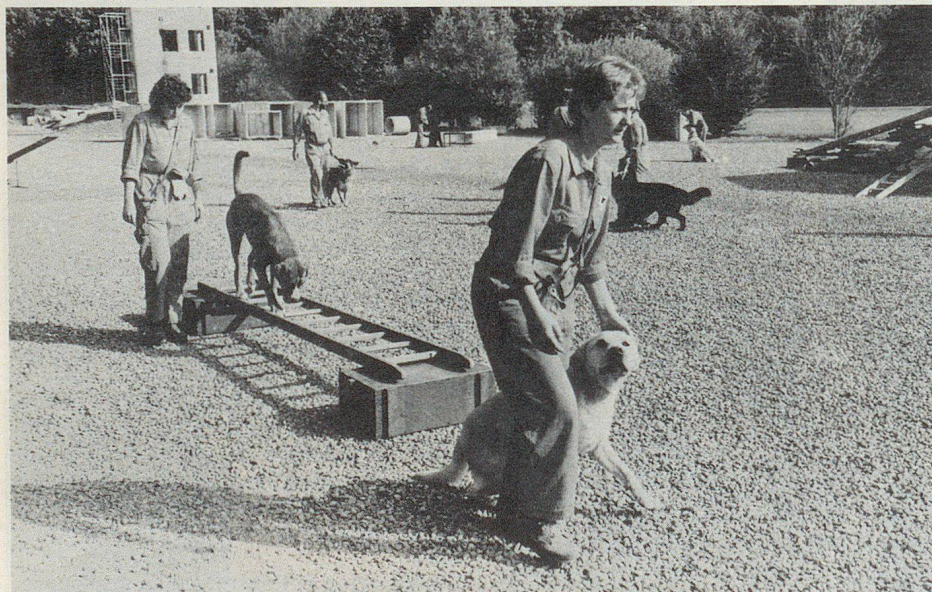
Pas facile, les échelles!

Avant d'offrir une petite collation à ses hôtes, le CRIE leur a encore proposé une démonstration de chiens de catastrophe. Une dizaine de jeunes bêtes de différentes races, âgées de 2-3 ans, ont effectué un parcours semé d'embûches de tous genres (échelles, balançoires, tonneaux, tunnel à ramper...), qui les habitue progressivement à évoluer sur terrains accidentés. Deux chiens «formés» ont fait la preuve de leur flair, en recherchant des personnes cachées sous les «décombres». Le spectacle a enthousiasmé toute l'assemblée, étonnée de la rapidité et de l'efficacité de ces collaborateurs à quatre pattes!