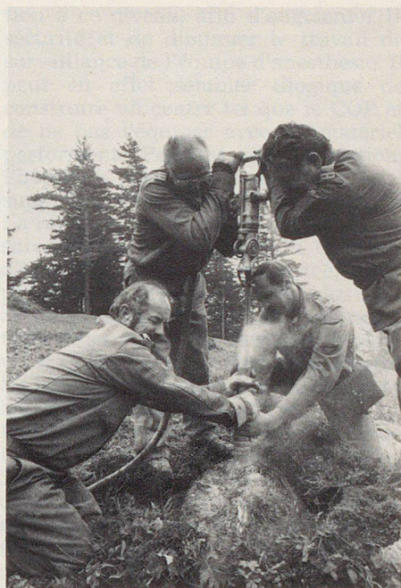
Die Arbeit der Betriebsschützer war hart, doch befriedigend und sinnvoll.

ze, die einerseits der Ausbildung und besonders benachteiligten Randregionen zugute kommen.