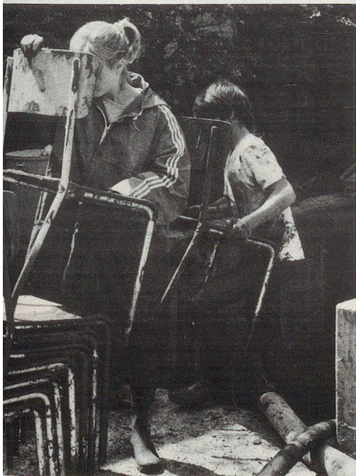
I resti del posto locale di comando inondato.