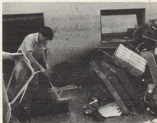
Quello che resta dopo il maltempo.