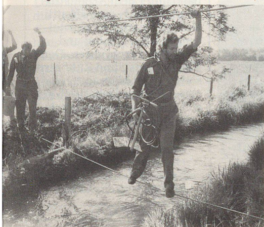
Akrobatik war gefragt...