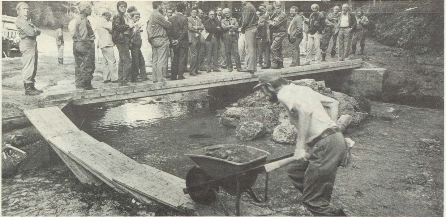
Engagement de la protection civile de la ville de Berne à Schwarzenbourg: un membre de la protection civile continue à travailler opiniâtement pendant que des personnalités soumettent le pont nouvellement construit à un essai de charge.

théorie d'engagement élaborée en une année et demie, les casques jaunes ont fourni un volume de travail de 200 000 francs environ. Les 100 habitants de Saxeten, qui ne peuvent compter qu'avec un rendement fiscal de 50 000 francs par année, leur ont été très reconnaissants du travail accompli. La troupe a dû, jour après jour, faire des trajets de quatre heures aller et retour sur des chemins pénibles. Les membres de la protection civile étaient cantonnés à Wilderswil, d'où ils étaient transportés par véhicules militaires à Saxeten. Depuis là ils devaient se rendre à pied jusqu'aux emplacements des chantiers.