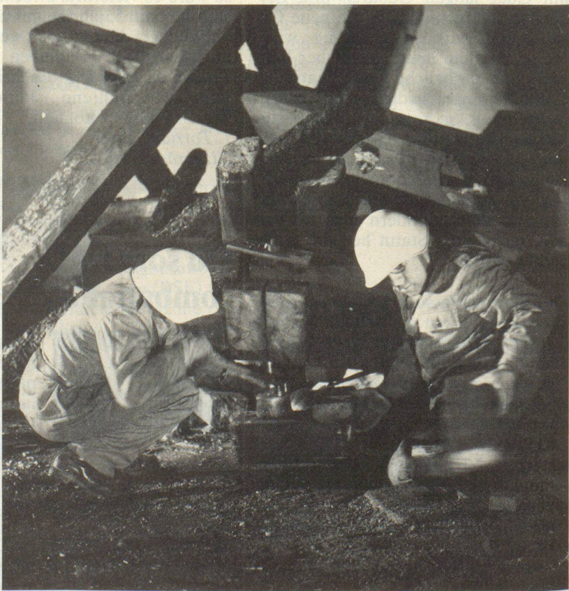
Heben will gelernt sein.

Für die verschiedenen Materialien existieren exakte Reibungszahlen, für unsere Zwecke genügen jedoch approximative Werte: