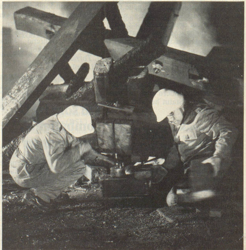
Heben will gelernt sein.

Für die verschiedenen Materialien existieren exakte Reibungszahlen, für unsere Zwecke genügen jedoch approximative Werte: